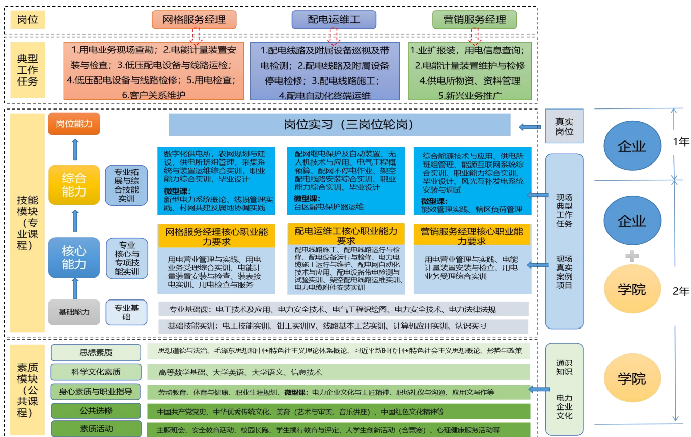
图2 “课程工作化、课程模块化、课程微型化”课程体系图